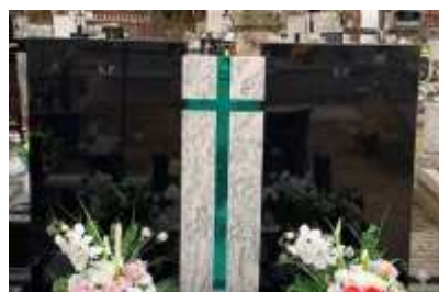
GLĘBIA I EMOCJE