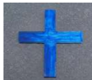
MONTAŻ NA PŁYCE